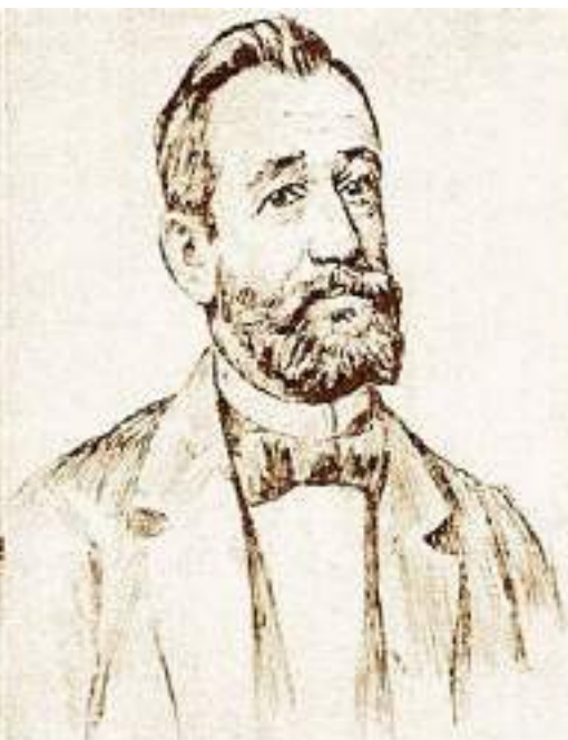
Ildefonso Pereira Correia BARÃO DO SERRO AZUL