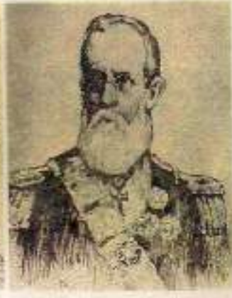
Visconde Henrique de Beaurepaire Rohan OBRAS DE BOM SENHOR DO SENADO PARANÁ