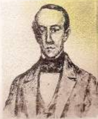
Comendador Zacarias de Góes e Vasconcelos OBRAS DE BOM SENHOR DO SENADO PARANÁ