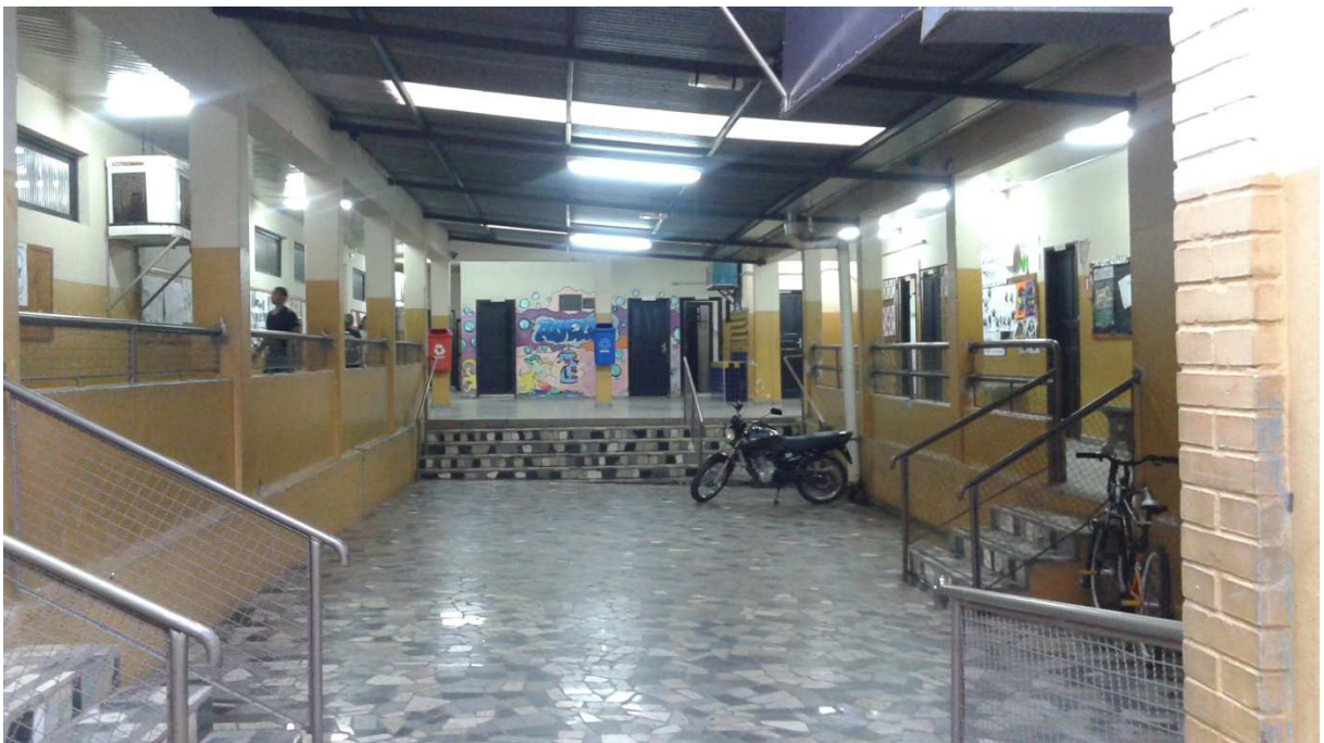
Figura 2: Pátio do CEC Adélia Rossi Arnaldi