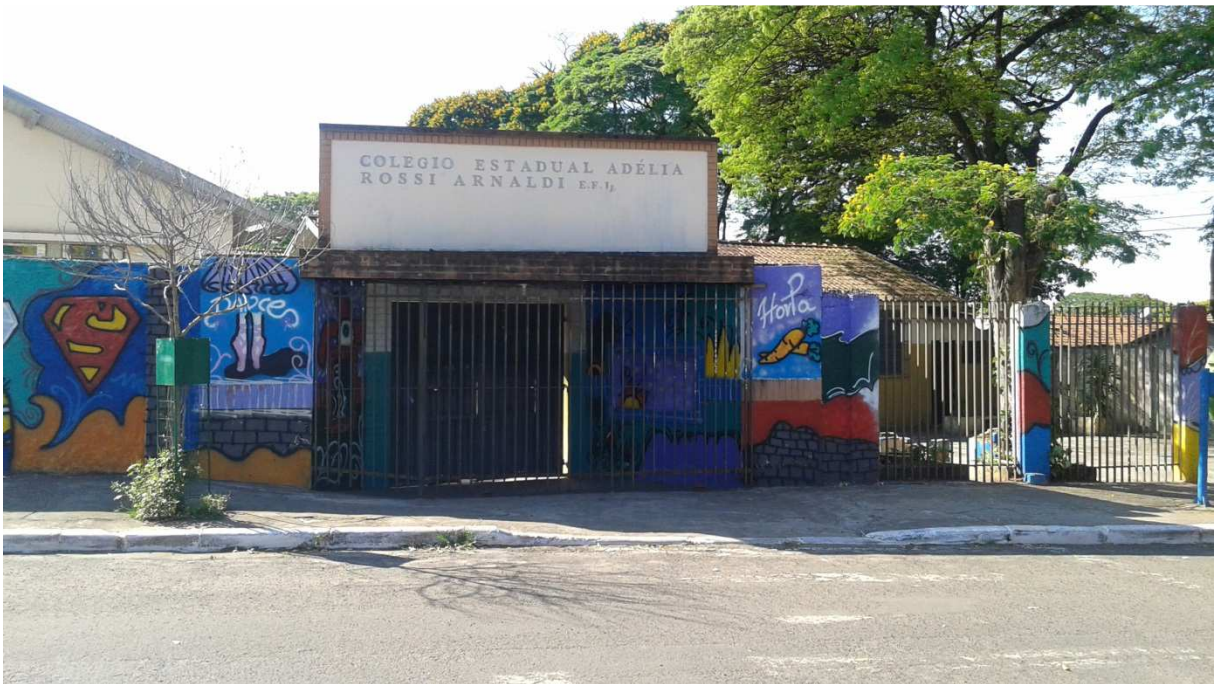
Figura 1: Fachada do CEC Adélia Rossi Arnaldi