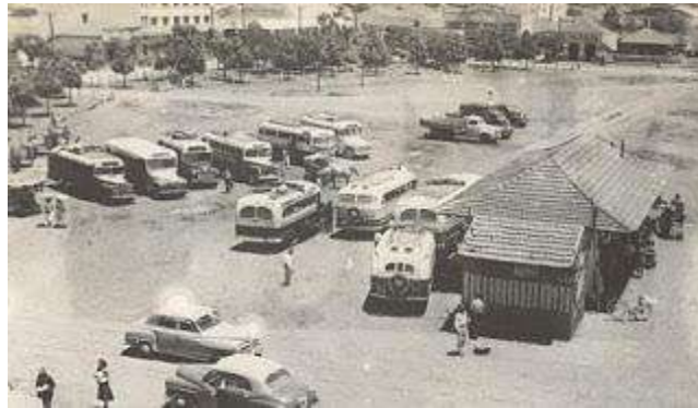
Figura 5 - Segunda Rodoviária, em imagem capturada por Kenji Ueta em 1953