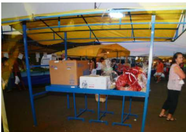
Figura 16 – Prêmios a serem sorteados