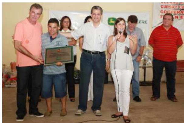
Figura 14 - O prefeito de Maringá, o vice-prefeito, entregam placa pelos 30 anos da Feira do Produtor ao presidente da Associação