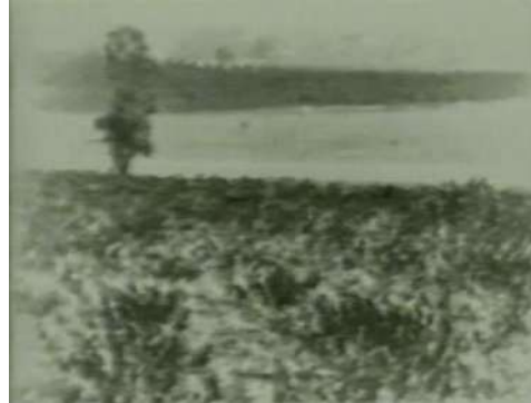
Figura 6 - Geadas negras, em julho de 1975