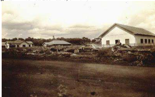
Figura 4 - Avenida São Paulo, em 1948