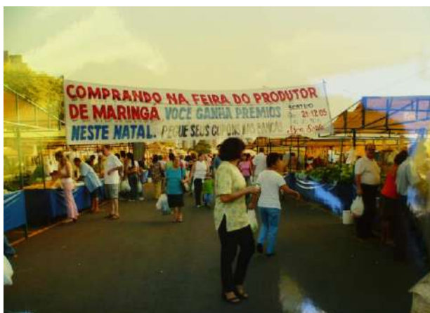
Figura 15 – Promoção prêmios de Natal