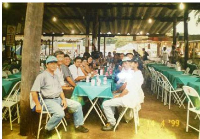
Figura 13 - Almoço em viagem de capacitação