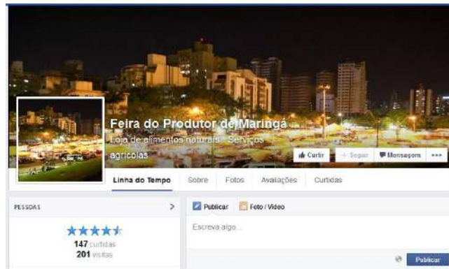
Figura 20 - Perfil da Feira do Produtor de Maringá no Facebook