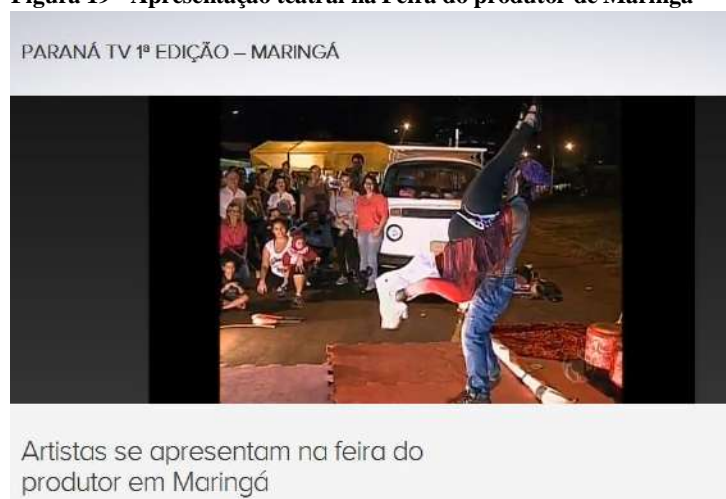
Figura 19 - Apresentação teatral na Feira do produtor de Maringá