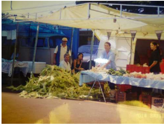
Figura 9 - Trabalho familiar na Feira do Produtor de Maringá