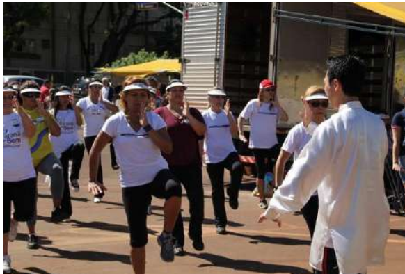
Figura 18 - Aula de tai chi chuan na Feira do Produtor de Maringá

Também existem atividades esportivas realizadas na Feira, como a realizada pelo Movimento Saúde da RPC TV (Rede Paranaense de Comunicação):