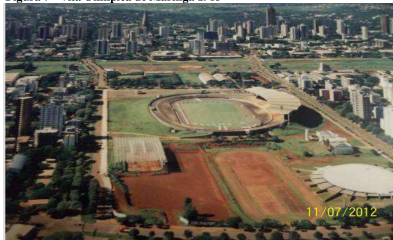
Figura 7 - Vila Olímpica de Maringá 1985