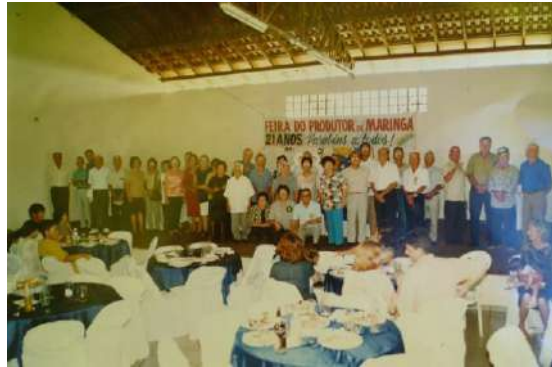
Figura 10 - Homenagem aos feirantes com mais de 85 anos