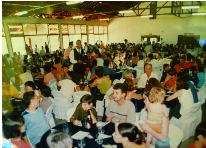
Figura 11 - Festa de aniversário da Feira do Produtor de Maringá por seus 21 anos