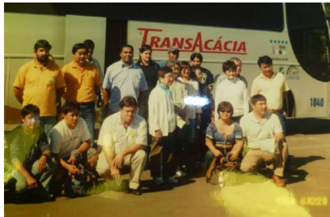
Figura 12 - Viagem de capacitação de feirantes da Feira do Produtor de Maringá