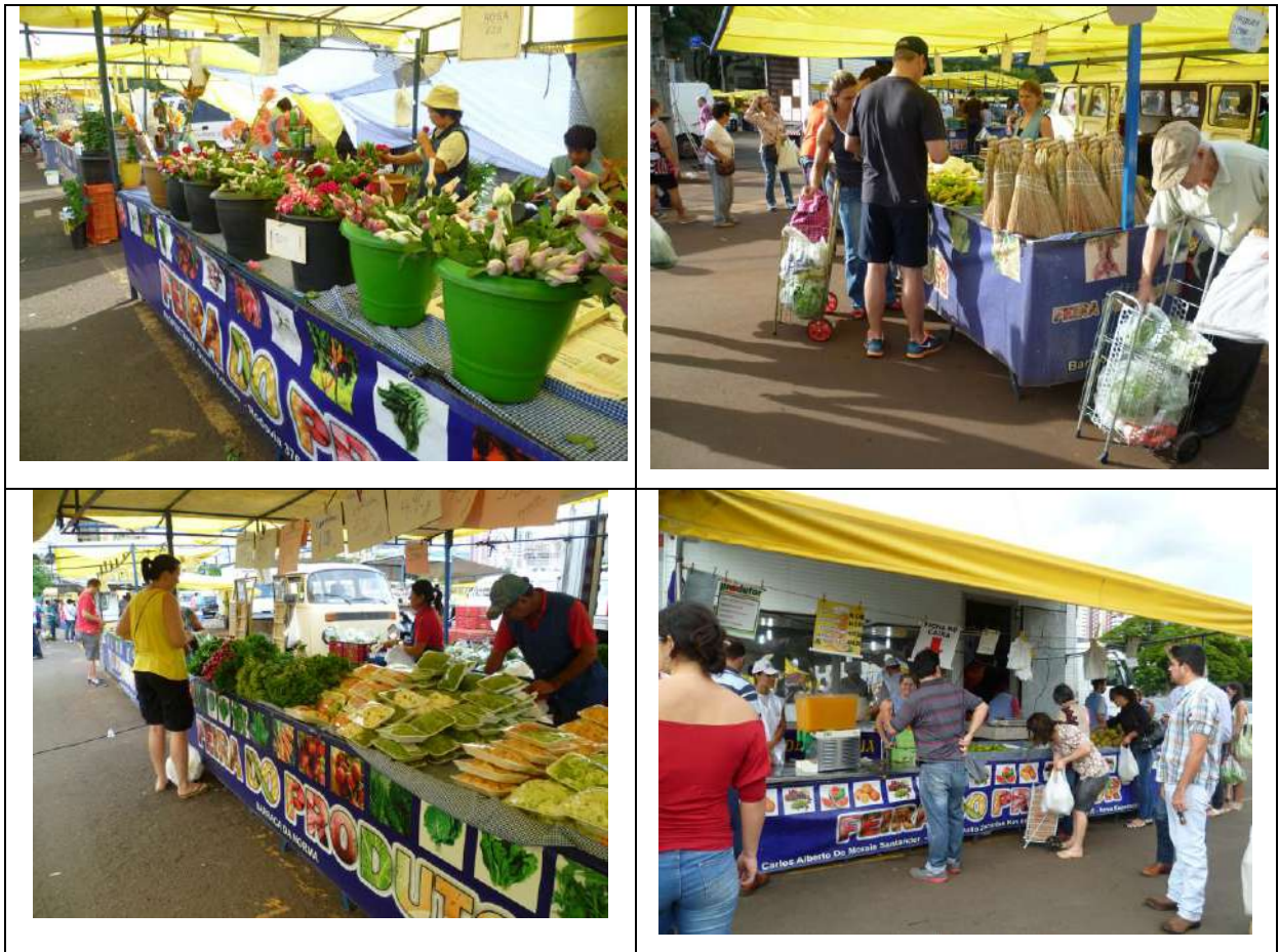
Figura 8 – Um sábado de manhã na Feira do Produtor de Maringá.