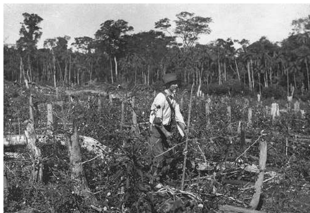
Figura 2 - Derrubada da mata e início da (re)ocupação no chamado Maringá Novo, no final da década de 40