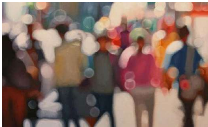
Figura 1 - Glow II