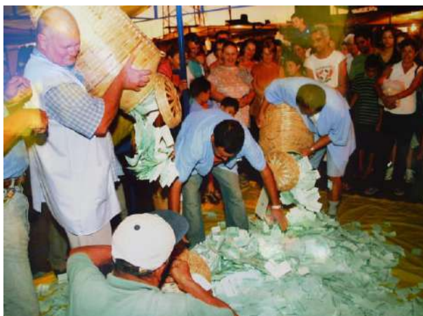
Figura 17 – Promoção prêmios de Natal – Sorteio de cupons