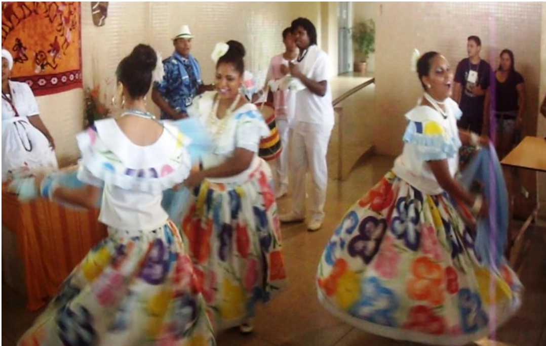
Frame 03: Grupo de dança de Marabaixo