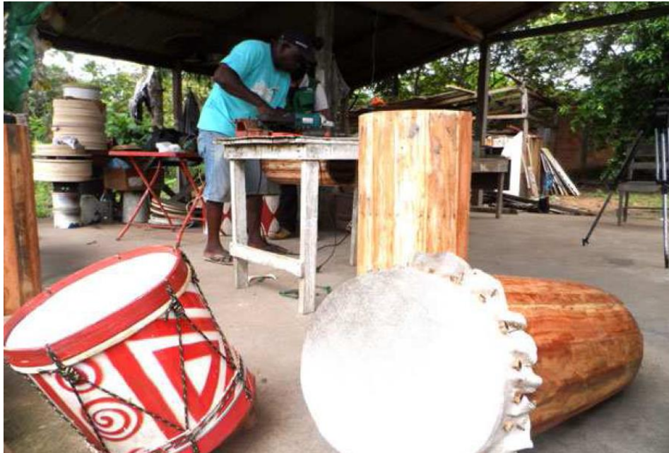
Figura 01: Artesão confeccionando caixas de marabaixo

rústicos herdados dos primeiros negros vindos da África e funcionam como uma espécie de ligação entre o passado e o presente. O som produzido por essas caixas, que dá singularidade ao Marabaixo, foi objeto de conflito entre Igreja Católica e sujeitos negros, pois remetia às práticas de negros.