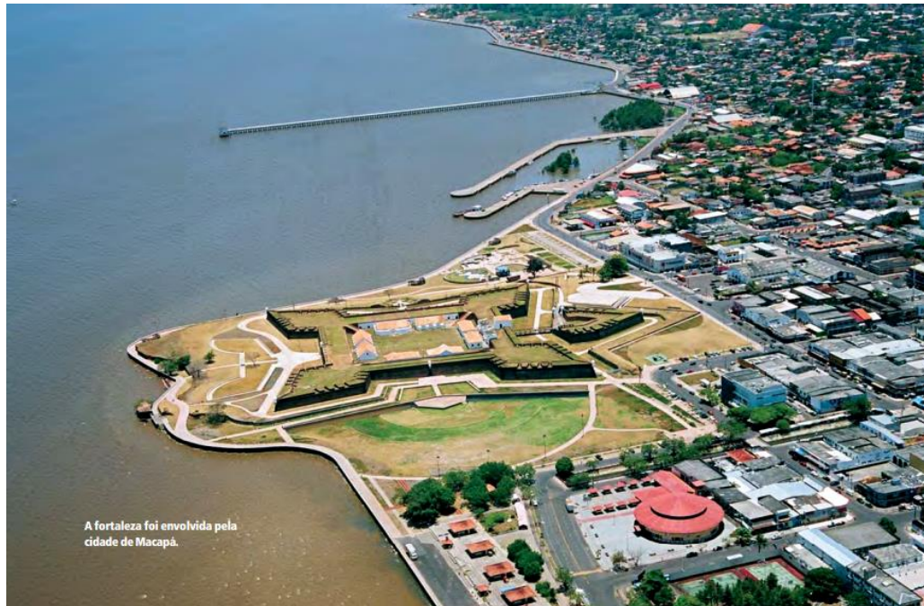
Figura 02: Fortaleza de São José de Macapá 15

Fonte: Foto de Alcino Campos (apud TEIXEIRA, 2006, p. 64).