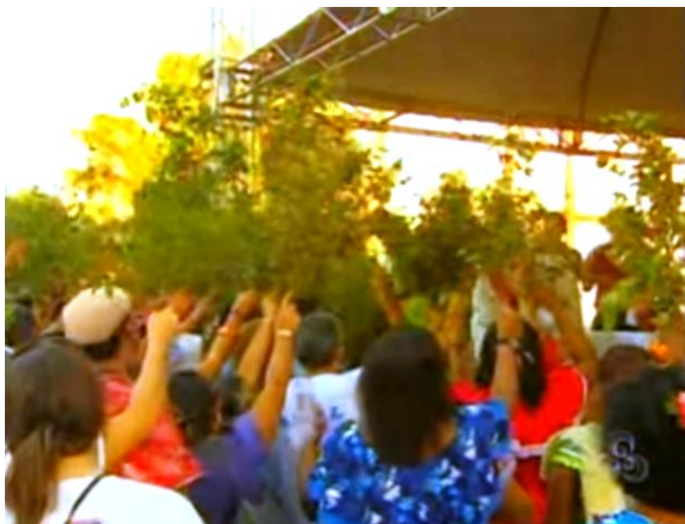
Frame 05: Cortejo da Murta de 2013

Como dito no Capítulo I, as festas de Marabaixo se dão com muita comida e bebida. Na maioria dos festejos, são servidos caldos de carne, de verduras e de legumes (cozidão), bolo de mandioca, tapioca etc. (OLIVEIRA, 1999; VIDEIRA, 2014). Na visita de Pereira (1989, p. 104) à região de Macapá, especialmente na localidade do Curiaú, ele descreveu uma bebida denominada de “mucura”, bebida própria daquele ambiente, feita de “[...] cachaça com ovo batido, lasquinhas de casca de limão e açúcar”. Entretanto, outra bebida tradicional acabou substituindo a mucura e tornou-se um elemento central nas festividades de Marabaixo, principalmente, na parte discursivizada como profana, isto é, fora das instalações da igreja. Essa bebida é a gengibirra, produzida, principalmente, à base de aguardente, gengibre, água e açúcar (ver Figura 05). De acordo com Araújo (2016), há relatos que a gengibirra traz energia aos festeiros para dançar até o amanhecer nas noites de Marabaixo, bem como no momento em que os mastros são erguidos e sustentados pelos sujeitos negros na frente das casas dos festeiros.