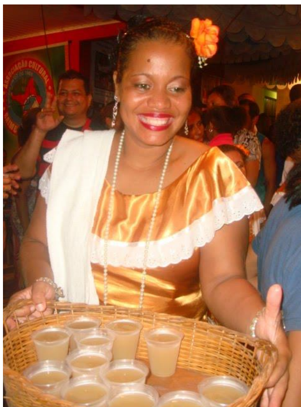
Figura 05: Gengibirra: a bebida dos sujeitos negros do Marabaixo

Esses três elementos (som, cantiga e dança) funcionam como mecanismo de subjetivação dos negros do Marabaixo. Objetos materiais e elementos imateriais com caracteres dos negros incomodaram a Igreja Católica, boa parte de seus seguidores e o Estado. De acordo com os estudos de Moles (1981, p. 11), “[...] a natureza humana tem horror do vácuo”. O autor ainda acrescenta que se o ambiente estiver vazio, o sujeito “[...] sentirá a tendência a preencher este vazio por uma revalorização dos elementos ditos ‘materiais’ do seu ambiente”. Num gesto de exercício de poder, os sujeitos negros revalorizaram esses elementos ao mesmo tempo em que rostificavam o Marabaixo e se constituíam como sujeitos dessas práticas. Assim, o som, os ladrões e as danças foram mecanismos de resistências contra as ações repressoras da Igreja e, também, do Estado.