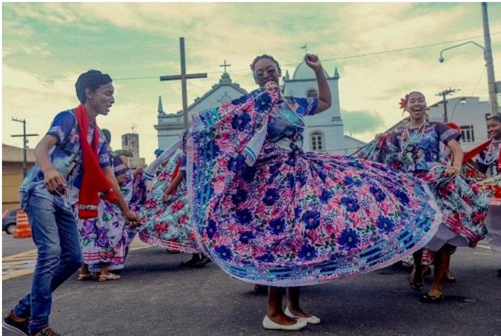
Figura 03: Sujeitos negros dançando o Marabaixo na frente da igreja de São José

40 do século XX, a Igreja intensificou os conflitos com os sujeitos negros do Marabaixo por considerar as suas práticas profanas e imorais e fechou as portas da igreja matriz de São José de Macapá para os festejos do Marabaixo. Era tradição, no Ciclo, fazer os cortejos até a igreja matriz e, com a proibição da Igreja, os sujeitos negros do Marabaixo não puderam mais entrar no estabelecimento religioso; entretanto, mantiveram o ritual até a frente da igreja (Figura 03).