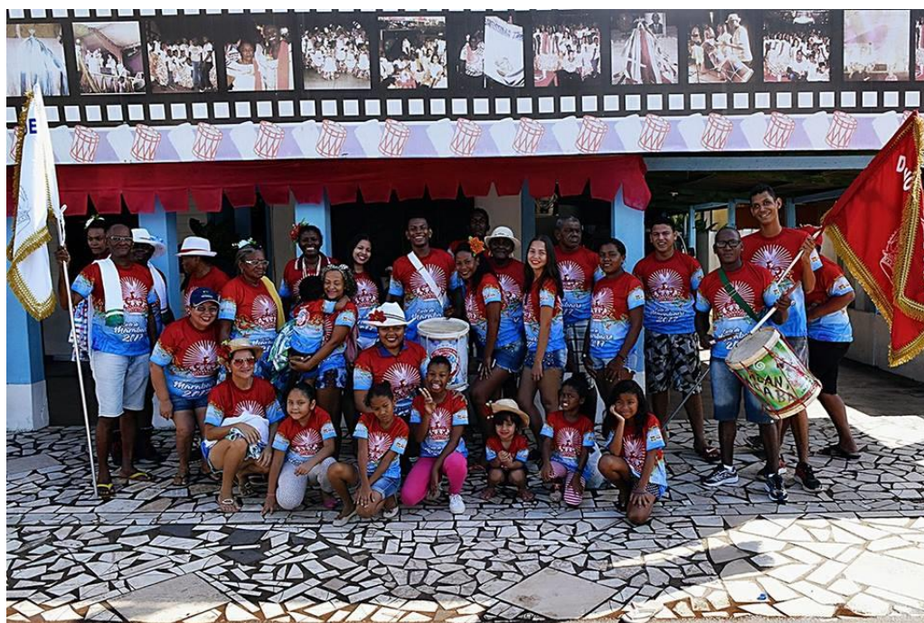
Figura 06: Sujeitos do Marabaixo do Pavão

A murta está presente nas práticas dos sujeitos negros, quando se trata do Marabaixo. No Quadro 01, com Programação do Ciclo do Marabaixo de Macapá do ano de 2017, observamos que há um dia específico para a quebra da murta no Curiaú pelos sujeitos negros do Marabaixo do Bairro Santa Rita (Favela), dia 03 de junho, e, no dia seguinte, acontece o Marabaixo da Murta. Já no Bairro Lagunho, temos a denominada Quarta-feira da Murta, dia 24 de maio, quando acontece também o levantamento dos mastros, e, no dia 04 de julho daquele ano, os sujeitos negros também participaram do Marabaixo da Murta.