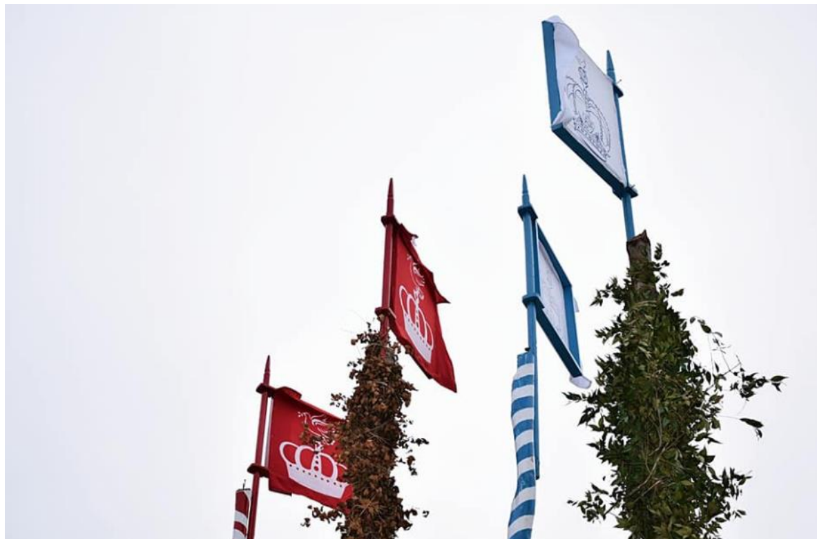
Figura 07: Os mastros no Marabaixo do Laguinho

troncos das florestas do Curiaú, mas sim uma prática ritualística movimentada com sons das caixas e com os versos dos ladrões de marabaixo. Esse acontecimento está inscrito no Calendário do Ciclo (ver Quadro 01).