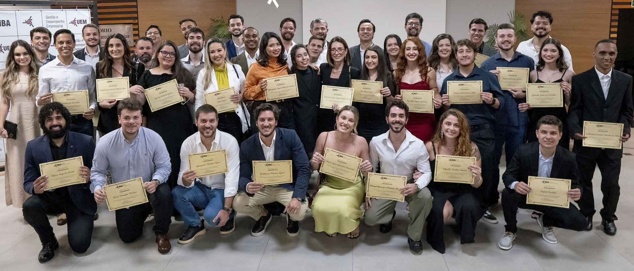
CONCLUSÃO DE CURSO DA TURMA 02