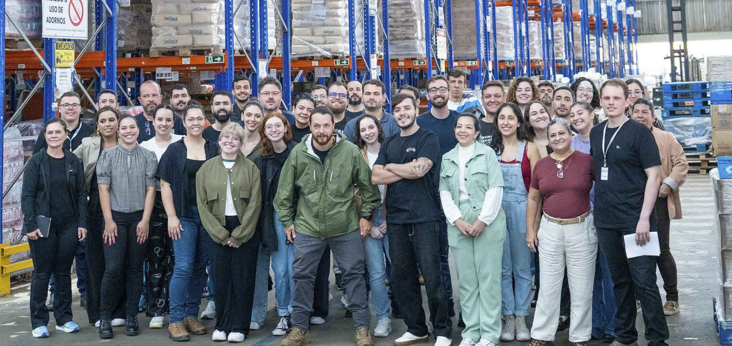
VISITA TÉCNICA - TURMA 03 Centro de Distribuição Mix Campeão / Camilo Supermercados